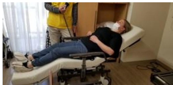
最新福祉機器の利用について見学