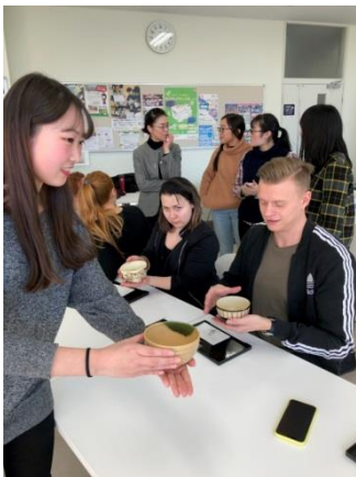
薬学科 3年 学生