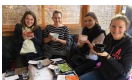
理学療法学科 4年 学生