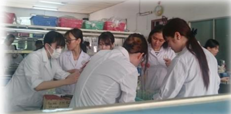
～ラボでの実習風景～