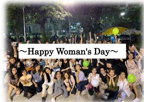
～Happy Woman's Day～