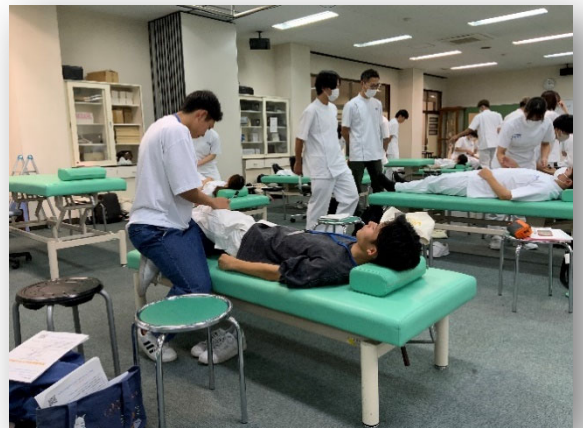
理学療法学科/ 理学療法セミナー2