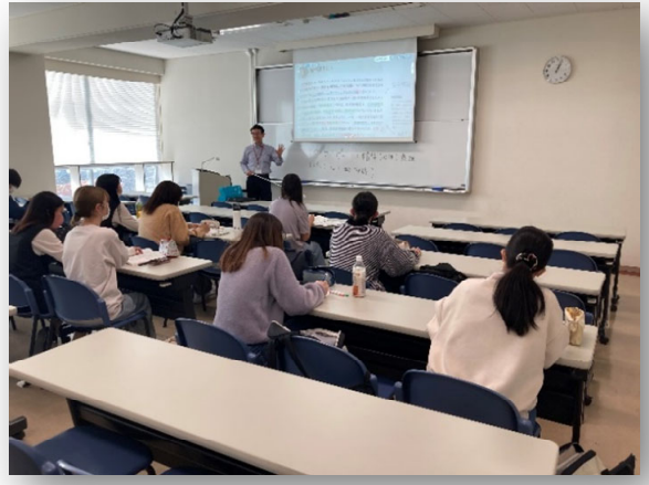
社会福祉学科/ 精神医学と精神医療Ⅱ