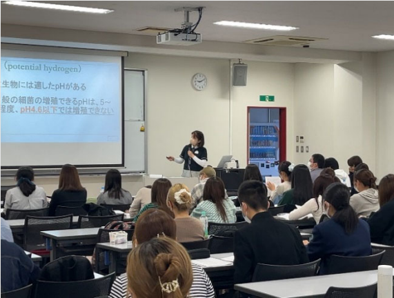
健康栄養学科/ 食品衛生学