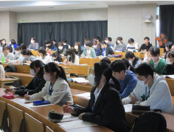
看護学科・理学療法学科/ 臨床医学Ⅰ(内科学・外科学)