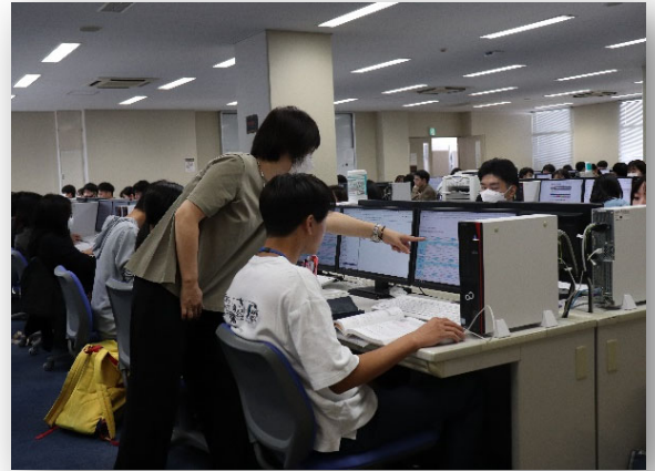
薬学科/ 臨床医薬品情報学