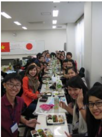
ウェルカムセレモニー後の交流

学生間の交流も年を重ねるごとに活発になっています。全学科から多くの本学学生がベトナム人学生受入れにあたっての企画や準備を積極的にしてくれました。今年度は初めて学生受入れによるホームステイを実施。一緒に“鍋パーティー”をしたり、和服の“着付け”をしてあげたりと、それぞれが精いっぱいのおもてなしをしました。ベトナム人学生からは日本への親切心や心遣いに感動したという声が多く聞かれました。