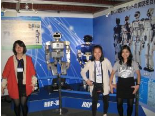
サイエンススクエア