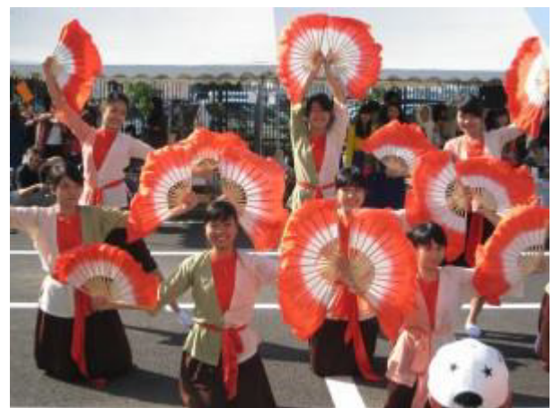
大学祭りでの踊りの披露